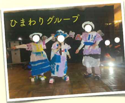
子どもたちとどんな魅せ方が 良いかじっくりと考え、自分らし く披露しています。

また、子どもたちの成長をそばで見守っている保護者の方などから「ここまで大きく育ててくれてありがとう」といった想いを伝えられるように、子どもたちに向けて言葉を伝える時間も感謝祭の中で大切にしています。